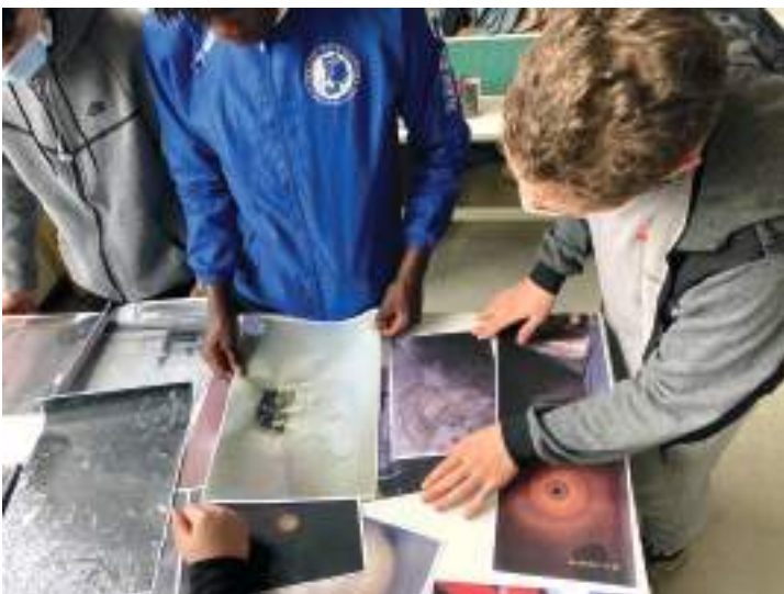
Choix des images

Quels sens portent les images ? Chacun donne sa version et son interprétation, les groupes s'écoutent et se répondent. Les échanges sont fluides et tout le monde exprime le fond de sa pensée. Des rires sont partagés, et très vite les pages sont tournées, découpées, assemblées pour créer une histoire.