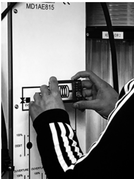
Séance du 28 janvier 2021

Pendant environ 1h30, les élèves ont pu se confronter à l'écart qui peut exister entre l'idée et sa réalisation. Très rapidement, ils ont montré beaucoup d'ingéniosité et de fierté vis-à-vis des photos réalisées.