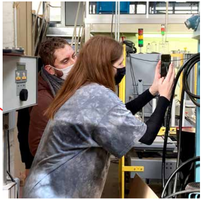
Séance du 28 janvier 2021

Pendant environ 1h30, les élèves ont pu se confronter à l'écart qui peut exister entre l'idée et sa réalisation. Très rapidement, ils ont montré beaucoup d'ingéniosité et de fierté vis-à-vis des photos réalisées.