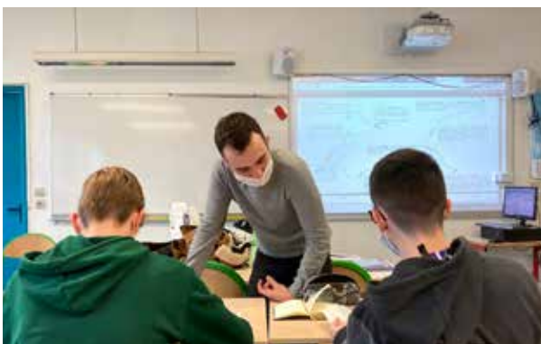
Séance du 13 janvier 2021