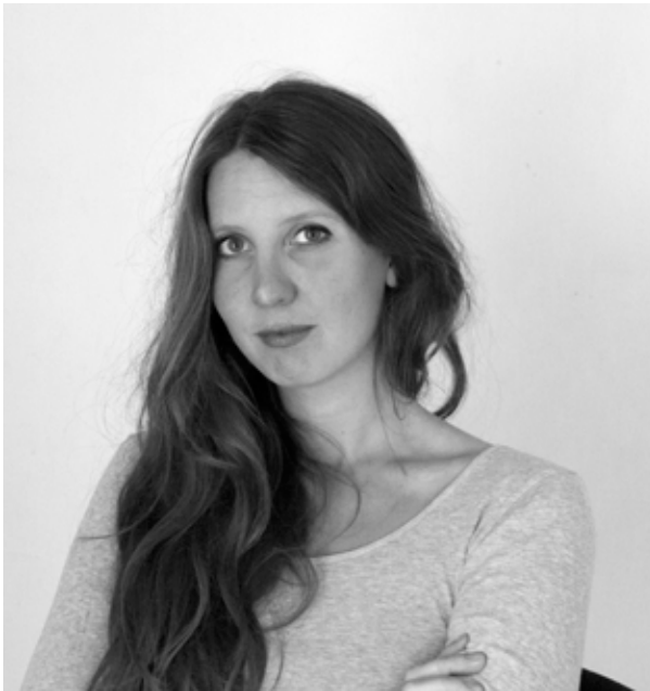
La photographe © Mathilde Geldhof

#triple_mixtes #uneartistedansmonlycée #cpif_ #audehors #camilleclaudel #mathildegeldhof