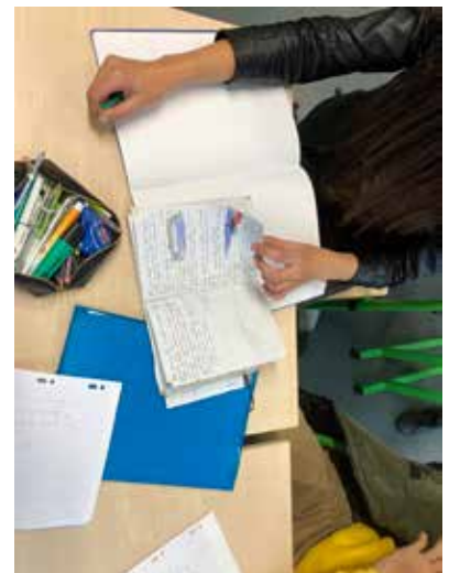
Séance du 13 janvier 2021

Les élèves tournent les pages, surlignent et soulignent, nous expliquent leurs choix, se laissant guider par leurs intuitions et la façon dont ils et elles comprennent les textes. Certain.e.s ont des idées très précises d'images ou de dispositifs de prises de vue : construction de pyramides en maquette, bateau dans une bassine d'eau. Pour d'autres, l'écho se fait avec leur vie actuelle et intime. La classe entière accueille le projet avec plaisir et enthousiasme et Guilhem Jarjat se promet de trouver lui aussi un extrait et de réaliser