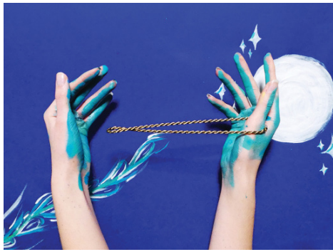
Projet Triple-Mix(te)s, Lycée Van Dongen, 2021-2022.