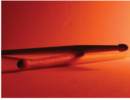
Projet Triple-Mix(te)s, Lycée Van Dongen, 2021-2022.