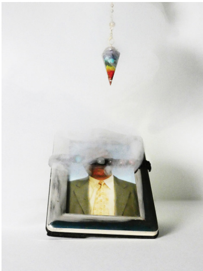
Projet Triple-Mix(te)s, Lycée Van Dongen, 2021-2022.