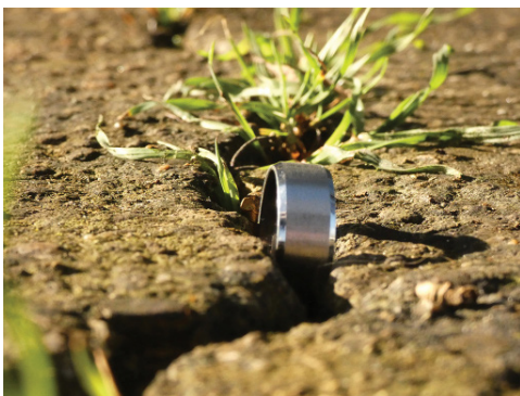
Projet Triple-Mix(te)s, Lycée Van Dongen, 2021-2022.

L'objet choisi est métamorphosé en tant que sujet principal de la photographie. Il sort de son cadre du quotidien pour devenir autre.