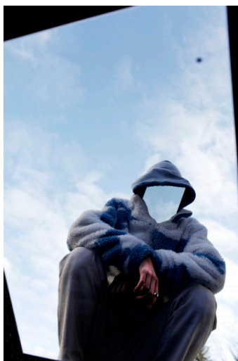
Projet Triple-Mix(te)s, Lycée Camille Claudel, 2021-2022.

La distance entre les éléments les plus proches et les plus éloignés d'une scène qui semble être « nettement acceptable ». C'est à dire l'espace qui sera net lors de la prise de vue.