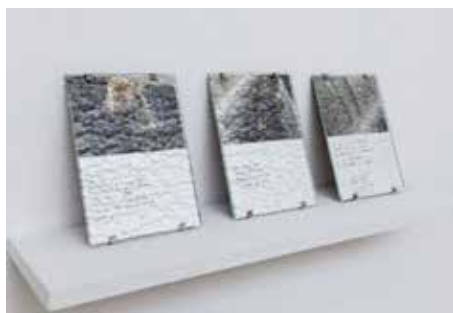
Mathilde Geldhof, Vues d'un paysage , ensemble de 3 duo de cartes postales sous verre texturé 21 X 14,8 cm chaque, 2019.