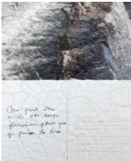
Mathilde Geldhof, Vues d'un paysage , ensemble de 3 duo de cartes postales sous verre texturé 21 X 14,8 cm chaque, 2019.

De la photo, on dit souvent qu'elle est instantanée : qu'elle est réalisée dans un temps immédiat et qu'elle permet de saisir (on dit même parfois de voler, d'attraper, de capturer) un instant. Mais une photographie peut aussi être mise en scène : être non pas le fruit du hasard ou d'un moment mais celui d'une composition longuement murie où les éléments (décors, objets, ou personnages) sont disposés et organisés volontairement. Le photographe compose l'image, ce qui implique de réfléchir et de prendre le temps. La prise de vue vient donc en dernier, après de nombreuses opérations, de nombreuses expérimentations, de nombreux choix. Souvent les photographes utilisent un studio pour faire des mises en scène. Artificielle plutôt que naturelle, la lumière peut y être modulée et travaillée.