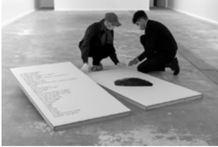
Collectif conversation, La Sauvagine , 2020

La photographie est bien souvent utilisée pour réaliser des portraits ou des autoportraits ( des portraits de soi). Mais il y a mille manières de réaliser l'un ou l'autre. On peut – c'est le plus courant – montrer un visage ou un corps entier. Dans ce cas, l'expression ou la position du corps traduiront souvent une expression : joie, colère, tristesse, etc. Mais on peut aussi faire le portrait de quelqu'un en montrant une autre partie du corps que le visage (une main, un cou, un œil, une poitrine) et même en ne montrant pas du tout le corps mais autre chose : une chambre, des objets, un paysage peuvent aussi montrer, raconter, exprimer quelqu'un.