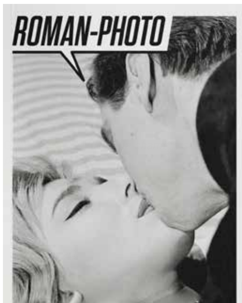
Affiche de l'exposition « Du ciné-roman au roman-photo », au Mucem à Marseille en 2017.