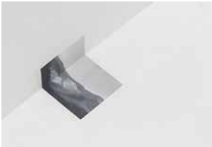
Collectif conversation, La Sauvagine , 2020

Le format désigne le rapport entre la largeur et la longueur d'une feuille, d'une photographie. On distingue, en photographie, différents types de formats : format carré, format portrait, format paysage, format panoramique par exemple. Parfois, une image peut exister en plusieurs formats.