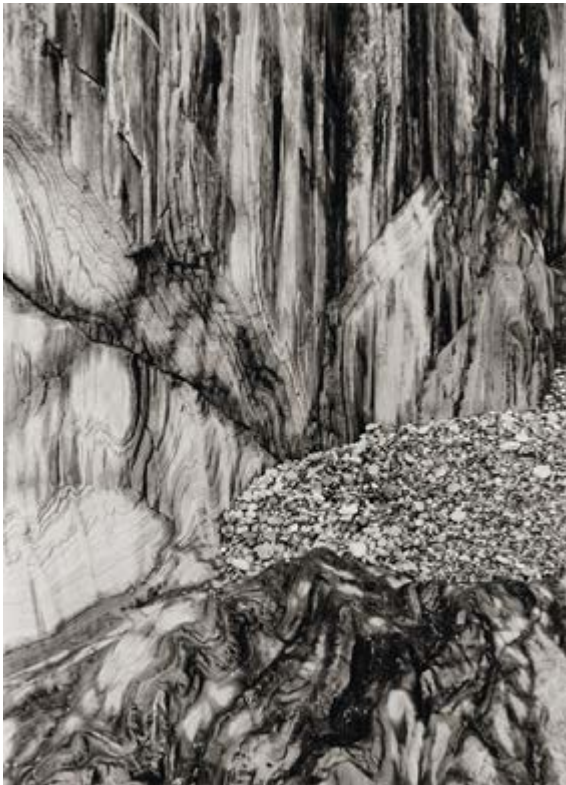
Mechanismus der Faltung [Mécanisme de plissement], 1962 Albert Renger-Patzsch © Albert Renger-Patzsch / Archiv Ann und Jürgen Wilde, Zülpich / ADAGP, Paris 2017