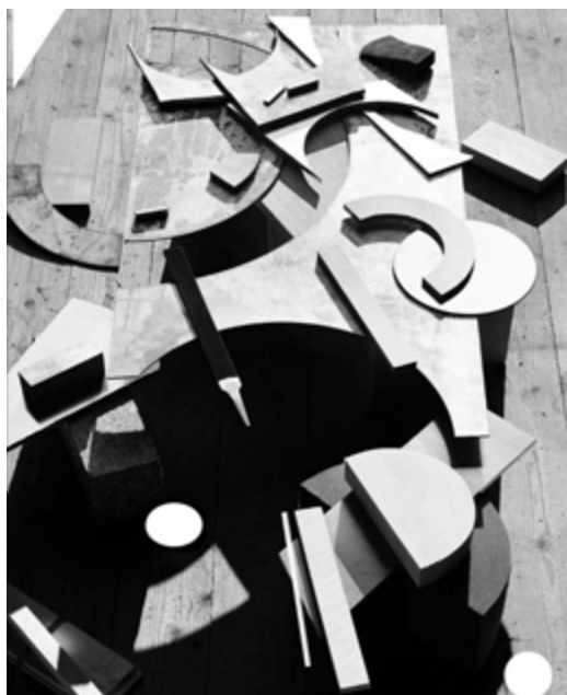
«File, Axe, Steel», 2018 de Matthew PORTER

Rencontre avec l'artiste ( sa démarche, son métier) Explication de l'atelier (ses enjeux, le rôle des élèves, la